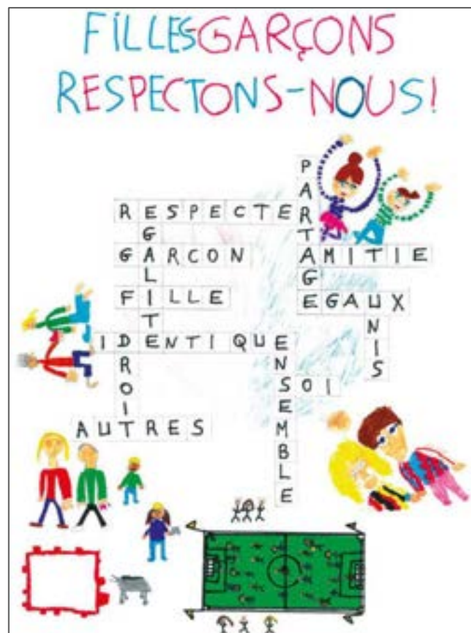
Lauréat 2019-2020 : Ecole élémentaire Meunerie - Dunkerque