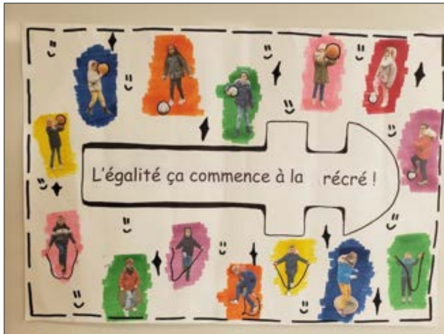
Lauréat 2022-2023 : Ecole primaire Pasteur – Frelinghien – CP-CE1